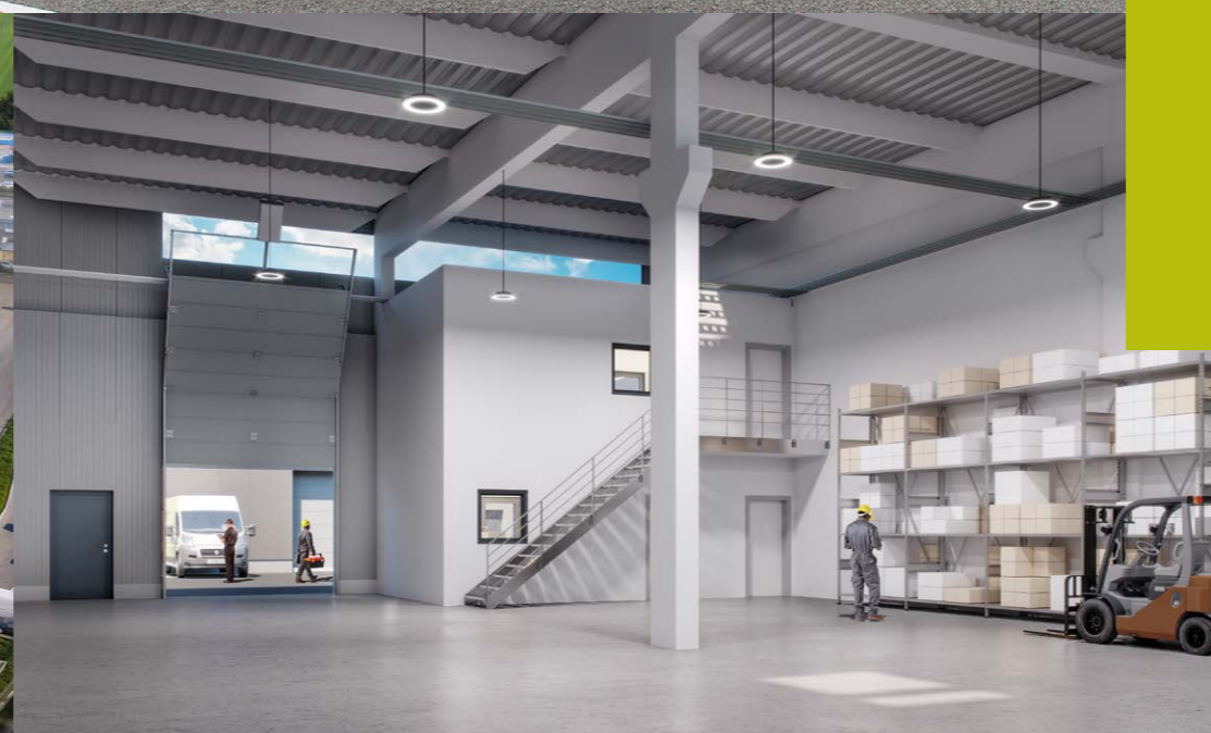
Beispielansicht Halle M.02